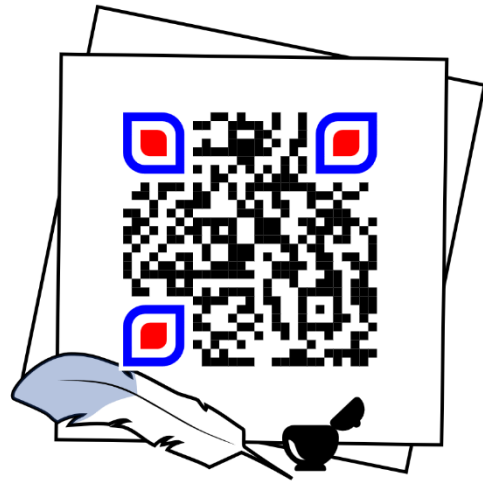
Morts pour la France